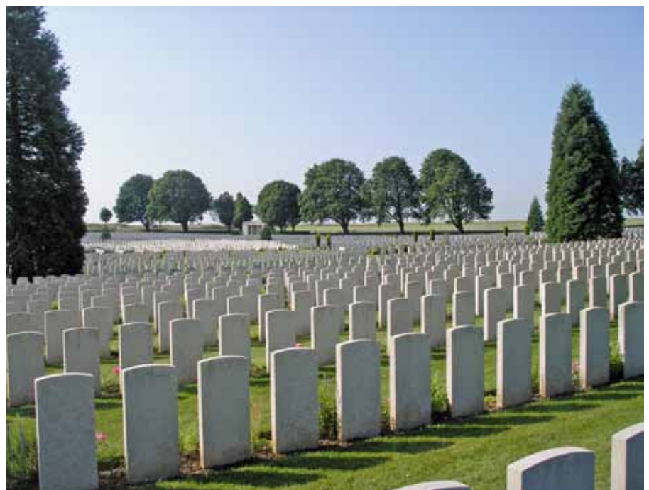
Britse militaire begraafplaats Cabaret Rouge

Goed per trein en auto te bereiken. De steden Arras en Lens bieden prima overnachtingsmogelijkheden. Of neem een landelijke B&B, zoals www.legoutdeshotes.eu/ in Ablain-Saint-Nazaire. Er zijn ook diverse bustrips te boeken. Meer info: www.wegenvanherdenking-noordfrankrijk.com