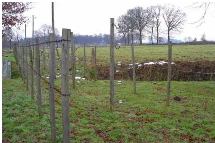
Vredesmonument de Dodendraad bij Zondereigen in België

De meeste slachtoffers waren spionnen, smokkelaars, Duitse deserteurs, Belgische vluchtelingen en onvoorzichtige burgers. Vaak stond er in de krant een bericht over iemand die was doodgebliksemd, oftewel in aanraking was gekomen met de Draad.