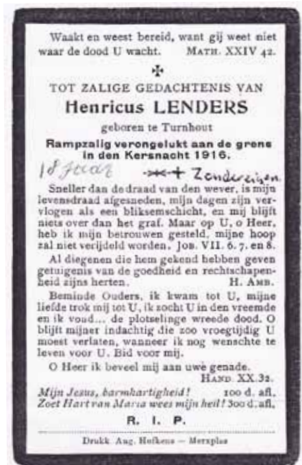
Hij smokkelde documenten.

Schattingen van het aantal door de Draad gedode mensen variëren van enkele honderden tot 850. Onbekendheid met elektriciteit verklaart deels het grote aantal slachtoffers.