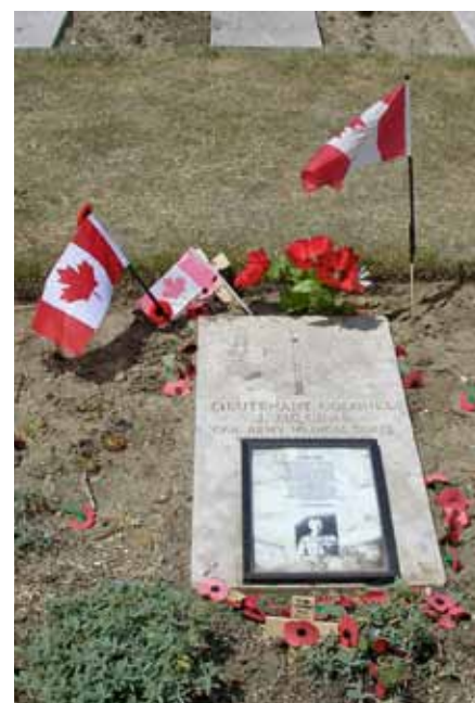
Liggende grafsteen McCrae

McCrae was niet tevreden en gooide het gedicht enige maanden later weg. Een collega zou het gedicht hebben gevonden en naar het tijdschrift Punch hebben gestuurd, dat het in december publiceerde.