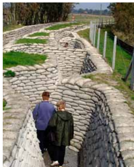
Loopgravencomplex bij Diksmuide

Als je de Westhoek bezoekt word je voortdurend herinnerd aan de Eerste Wereldoorlog. Honderden grotere en kleinere Britse, Belgische, Franse en Duitse oorlogsbegraafplaatsen markeren het landschap. Op bijna elk kruispunt verwijzen kleine groene bordjes naar een 'war cemetery'. In Ieper, Zonnebeke, Poperinge en Kemmel vertellen musea het verhaal van Den Grooten Oorlog. Iedere avond wordt om stipt acht uur onder de Menenpoort in Ieper de 'Last Post' geblazen. Een traditie die al sinds de zomer van 1928 bestaat en alleen onderbroken werd tijdens de Tweede Wereldoorlog. Agenten zetten het verkeer stil en de blazers van de vrijwillige brandweer van Ieper stellen zich op voor de ceremonie. Elke dag, zomer of winter, regen of zonneschijn weerklinkt het befaamde Britse militaire eresaluut. Soms zijn er honderden toeschouwers, soms een handjevol.