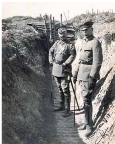
Keizer Willem II (I) in een loopgraaf

Willem omringde zich in zijn nieuwe huis met meubilair en kunstvoorwerpen die