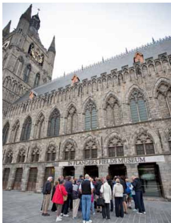
Het In Flanders Field Museum te Ieper

Dit artikel verscheen eerder in de Reisgids, mei/juni 2011