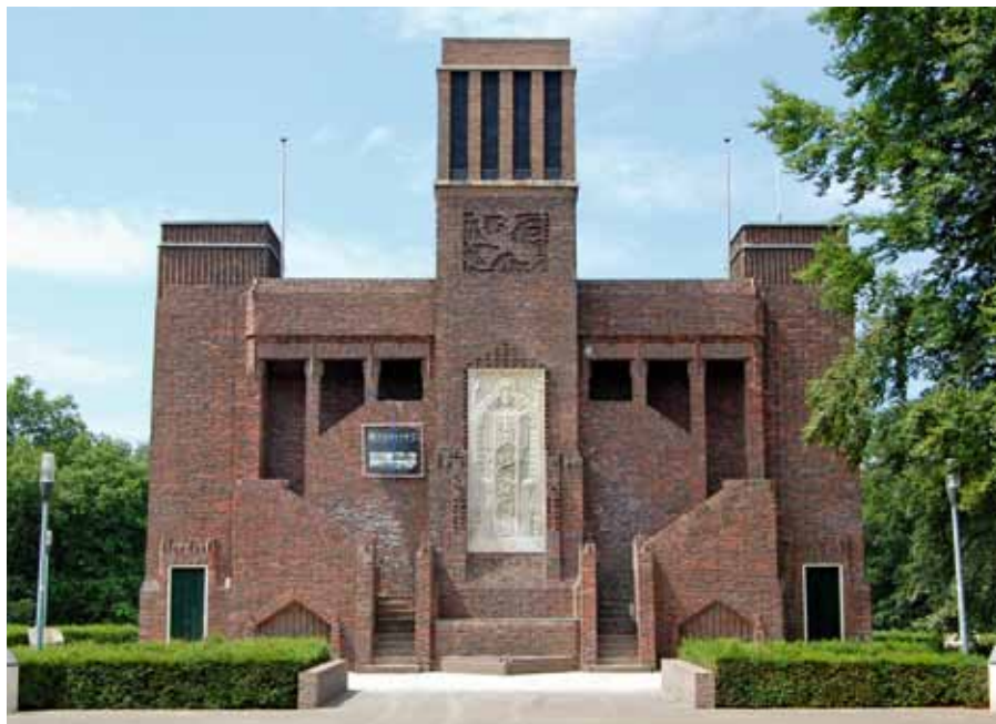
Het Belgenmonument in Amersfoort