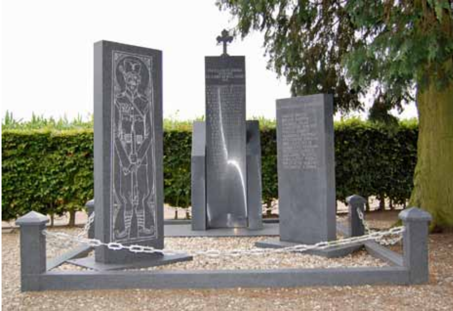
Monument voor Servische militairen in Garderen

In dit nummer staat de Eerste Wereldoorlog centraal. Maar oorlogen brengen altijd andere rampspoed met zich mee. En onheil in de vorm van gebrek, plundering, verkrachting en ziektes treft vooral de burgerbevolking. Zo ook dit keer. In het laatste oorlogsjaar brak de Spaanse Griep uit. Terwijl de oorlogvoerende partijen de Nederlandse neutraliteit respecteerden, stopt een besmettelijke ziekte niet bij de grens. Veel funeraire sporen uit de Eerste Wereldoorlog in Nederland verwijzen daarom naar de Spaanse Griep.