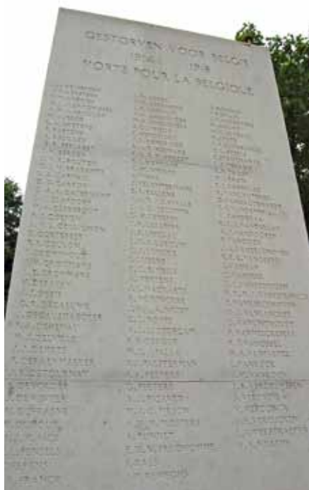
Namen van niet-begraven militairen

Tekst: Antoinette Hofman, student geschiedenis Radboud Universiteit Nijmegen