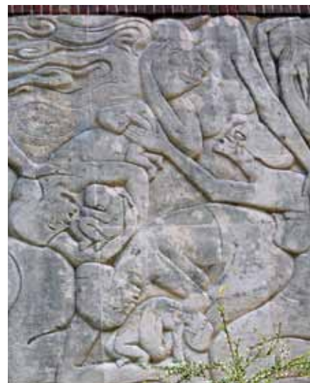
Detail uit het beeldhouwwerk van Hildo Krop